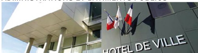
Hôtel de ville Haubourdin