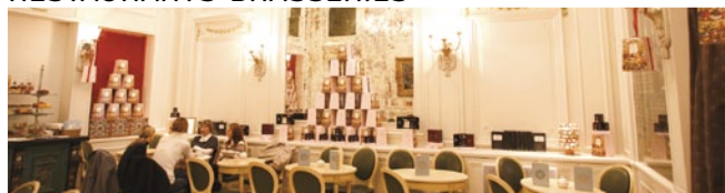
Salon de Thé Meert Lille