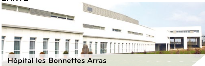
Hôpital les Bonnettes Arras