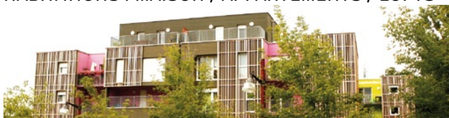
Faubourg Ste Catherine Valenciennes