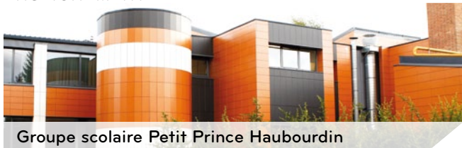
Groupe scolaire Petit Prince Haubourdin