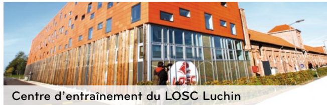
Centre d'entraînement du LOSC Luchin