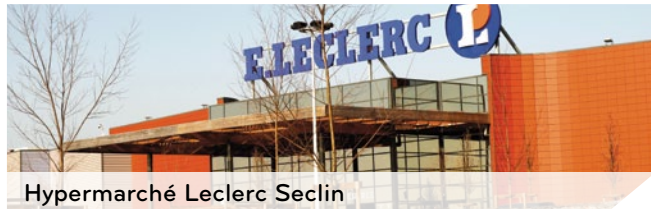
Hypermarché Leclerc Seclin

→ TOUTES NOS RÉALISATIONS RÉPONDENT AUX NORMES ÉNERGÉTIQUES EN VIGUEUR, EN CONFORMITÉ À LA RÉGLEMENTATION RT 2012, LABELS BBC (BÂTIMENT BASSE CONSOMMATION), BBC EFFINERGIE ET HQE (HAUTE QUALITÉ ENVIRONNEMENTALE).